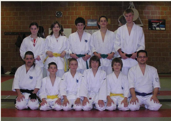
Enkele van onze jeugdleden

Sporthal Houthalen-Oost Vogelkersstraat 2 3530 Houthalen